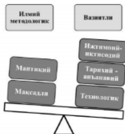
2-расм. Конфликтни бошқаришдаги зарурий ёндашувлар.

тадқиқ этилаётган объектнинг хусусиятини илмий методлар ва воситалар ёрдамида таҳлил қилиш. Мисол учун "Science" илмий журналида эълон қилинган COVID-19нинг мавсумийлиги ва касалланишнинг динамик моделининг олимлар томонидан илмий ёндашув асосида таҳлил қилиниши бунга ёрқин мисол бўлади.